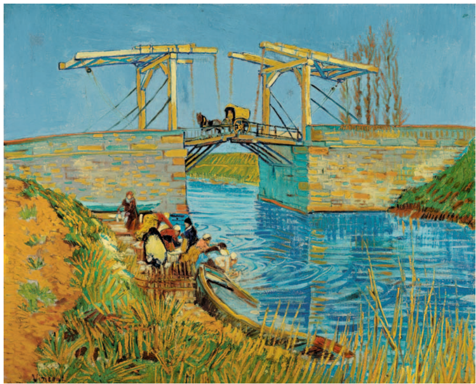
Vincent van Gogh, Puente en Arles (Pont de Langlois), marzo de 1888