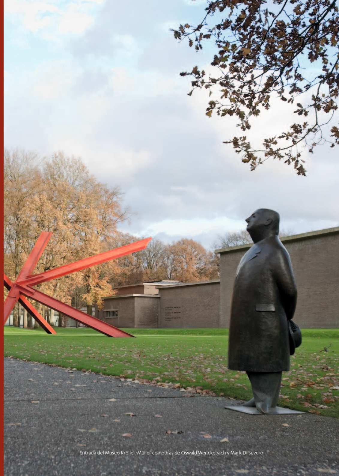
Entrada del Museo Kröller-Müller con obras de Oswald Wenckebach y Mark Di Suvero