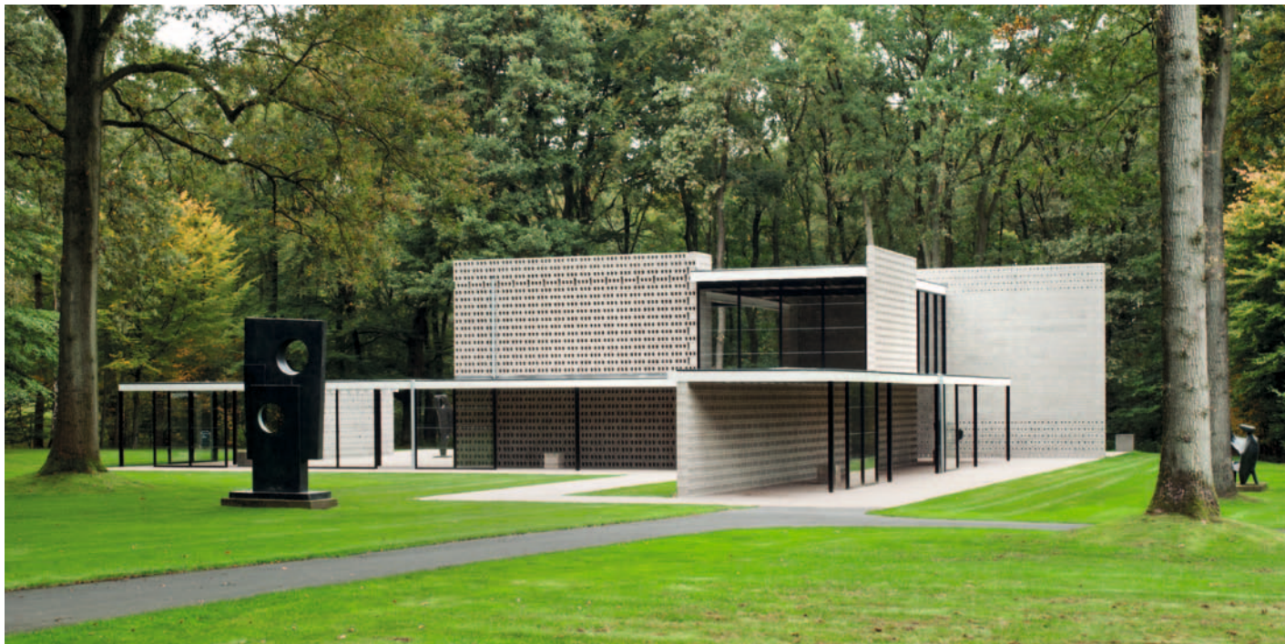
Pabellón Rietveld con obras de Barbara Hepworth