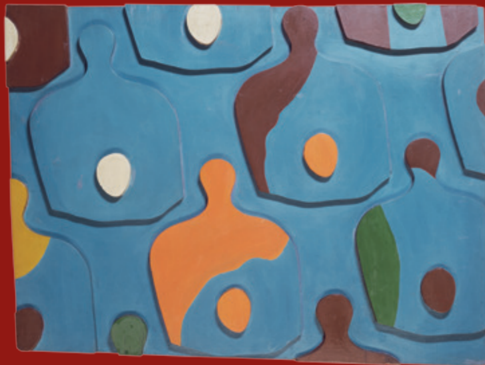
La planche à oeufs, 1922, Particuliere collectie/Private Collection