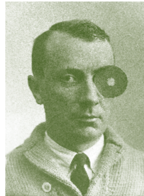
Arp met Navel-monocle, circa 1926 Arp with Navel-Monocle, circa 1926

Arp: The Poetry of Forms sluit aan bij het internationale themajaar Mondrian to Dutch Design, 100 years of shaping the world naar aanleiding van de oprichting van De Stijl honderd jaar geleden. Met een omvangrijk programma eren musea en erfgoedlocaties in heel Nederland Van Doesburg en de andere leden van het eerste uur, zoals Piet Mondriaan, Bart van der Leck en Vilmos Huszár.