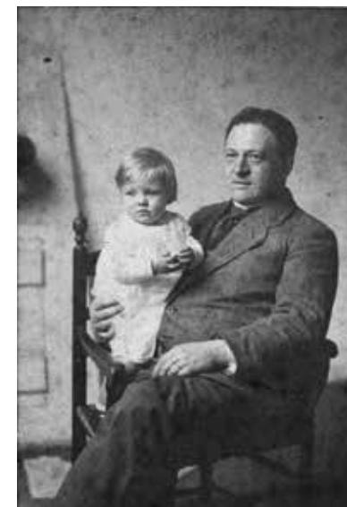
Bart van der Leck met dochter op schoot, 1915 Bart van der Leck with his daughter on his lap, 1915

De tentoonstelling sluit aan bij het internationale themajaar Mondrian to Dutch Design, 100 years of shaping the world naar aanleiding van de oprichting van De Stijl honderd jaar geleden. Met een omvangrijk programma eren musea en erfgoedlocaties in heel Nederland Bart van der Leck en de andere leden van het eerste uur, zoals Piet Mondriaan, Theo van Doesburg en Vilmos Huszár.