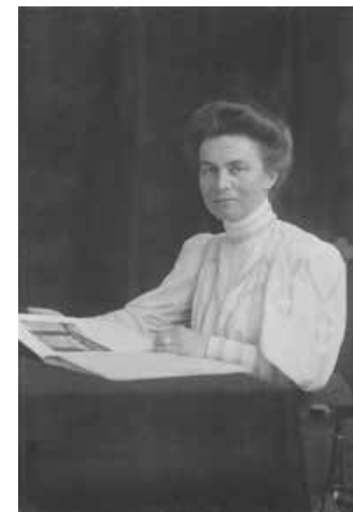
Helene Kröller-Müller, circa 1910 Helene Kröller-Müller, c. 1910 Kröller-Müller Museum, Otterlo