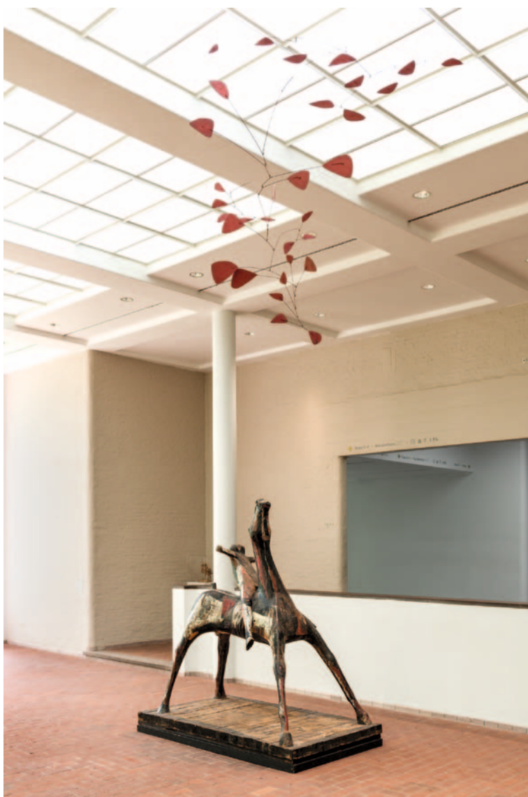
Camera delle sculture con opere di Marino Marini e Alexander Calder

Il museo Kröller-Müller raccoglie il bello. È un mix unico di arte, natura e architettura che garantisce un'esperienza davvero speciale. Un'esperienza che stimola tutti i sensi. Il museo è un autentico paradiso per tutti gli intenditori e amanti delle arti figurative, così come per tutti coloro i quali si affacciano al mondo dell'arte con la spontaneità tipica dei profani. Non c'è altro luogo al mondo in cui è possibile assaporare l'intenso godimento di una straordinaria collezione d'arte, situata in uno splendido angolo di natura. Con oltre 400.000 visitatori all'anno, il museo Kröller-Müller è uno dei più visitati dei Paesi Bassi. La sua collezione attira anche numerosi amanti dell'arte a livello internazionale. I capolavori dati in prestito a musei di ogni parte del mondo attraggono infatti milioni di visitatori.