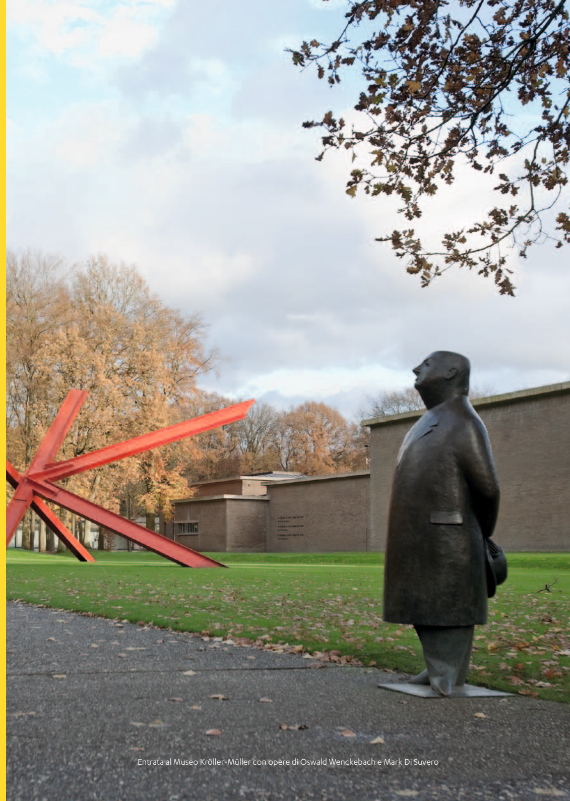
Entrata al Museo Kröller-Müller con opere di Oswald Wenckebach e Mark Di Suvero