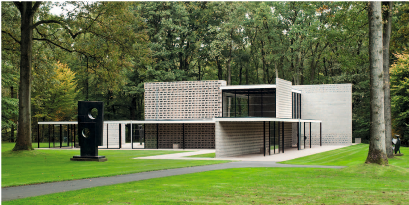
Padiglione Rietveld con opere di Barbara Hepworth