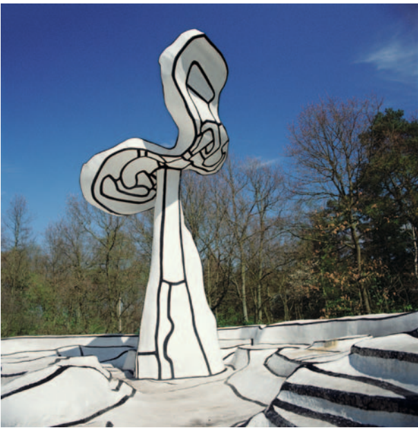
Jean Dubuffet, Jardin d'émail , 1974

Il museo è circondato da uno dei giardini di sculture più grandi d'Europa. Un'enorme sala all'aperto di 25 ettari in cui la scultura moderna trova la sua destinazione naturale. Sparse per il giardino sono esposte oltre 160 sculture di artisti leggendari come Aristide Maillol, Jean Dubuffet, Marta Pan e Pierre Huyghe. I dintorni invitano a godere sia delle sculture che della natura. Che ci si voglia stendere sul prato, fare un picnic o una corsa, il giardino delle sculture è destinato a tutti.