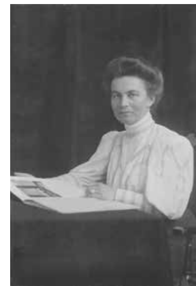
Helene Kröller-Müller, environ 1910 Helene Kröller-Müller, etwa 1910