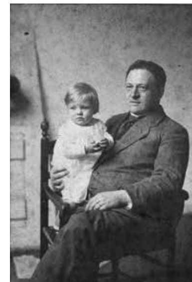
Bart van der Leck avec sa fille sur ses genoux, 1915 Bart van der Leck mit Tochter auf dem Schoß, 1915 RKD, Den Haag

L'exposition s'inscrit dans l'année thématique internationale Mondrian to Dutch Design, 100 years of shaping the world en l'honneur du centenaire de la fondation du mouvement De Stijl. À travers un imposant programme, des musées et sites du patrimoine de l'ensemble des Pays-Bas rendent hommage à Bart van der Leck et aux autres membres de la première heure, notamment Piet Mondriaan, Theo van Doesburg et Vilmos Huszár.