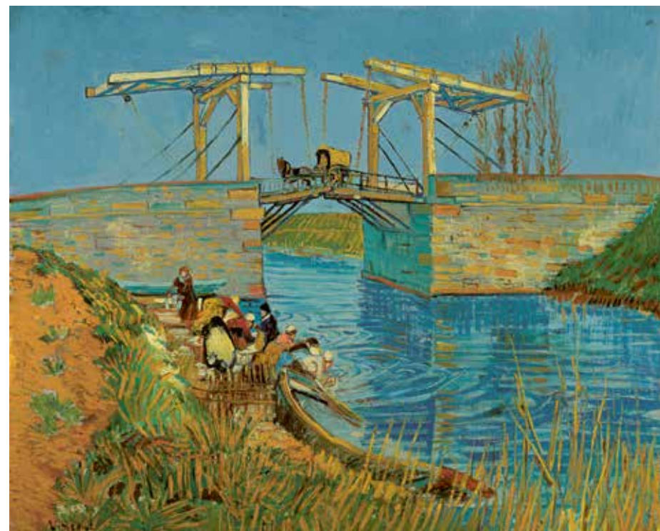
Vincent van Gogh, Brug te Arles (Pont de Langlois), midden maart 1888