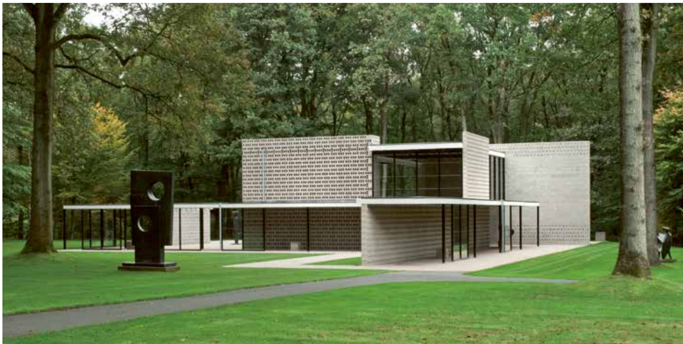
Rietveldpaviljoen met werk van Barbara Hepworth