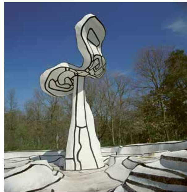
Jean Dubuffet, Jardin d'émmail, 1974

Het museum wordt omgeven door een van de grootste beeldentuinen van Europa. Een buitenzaal van 25 hectare waarin moderne beeldhouwkunst een natuurlijke bestemming vindt. Verspreid door de tuin staan ruim 160 sculpturen van beeldbepalende kunstenaars, van Aristide Maillol tot Jean Dubuffet, van Marta Pan tot Pierre Huyghe. De omgeving nodigt uit om te genieten. Van de beelden én van de natuur. Lekker languit in het gras liggen, gezellig samen picknicken of rondjes rennen; de beeldentuin is er voor iedereen.