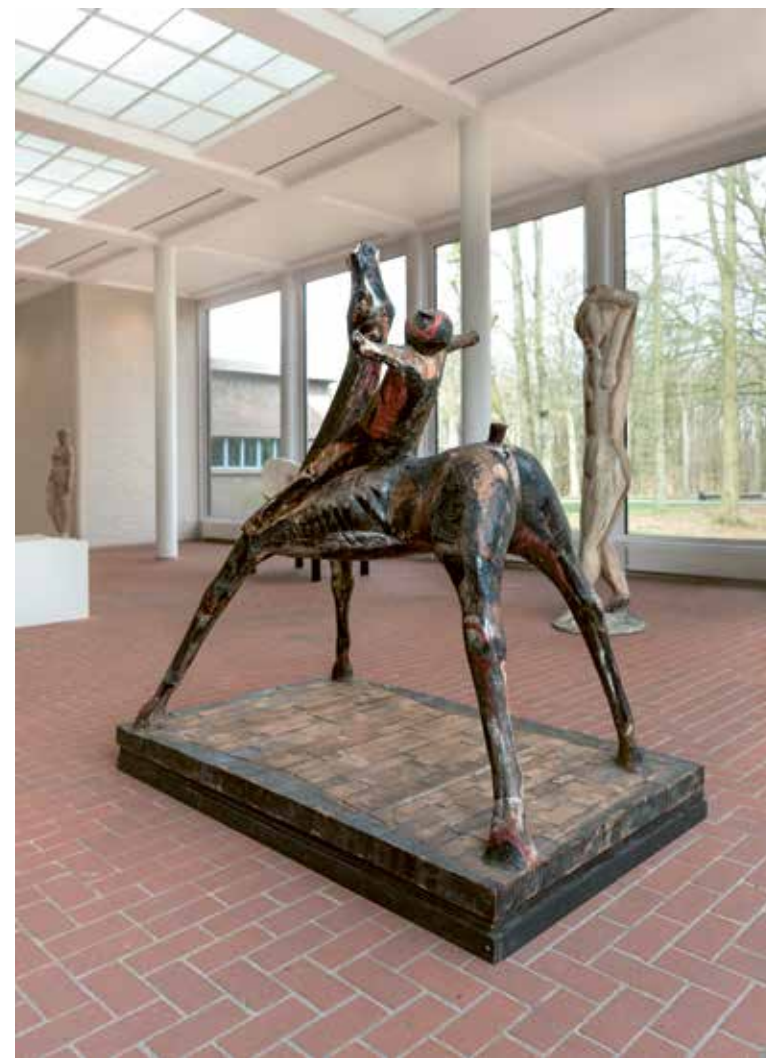
Beeldenzaal met op de voorgrond Paard en ruiter, 1951 – 1955, van Marino Marini

In het Kröller-Müller Museum komt al het schone samen. De unieke combinatie van kunst, natuur en architectuur staat garant voor een bijzondere ervaring. Een beleving die alle zintuigen prikkelt. Het museum is een paradijs voor ervaren kunstliefhebbers en onbevongen nieuwkomers. Nergens anders ter wereld geniet je zo intens van de kunst door de fenomenale collectie en de prachtige ligging midden in de natuur. Met bijna 400.000 bezoekers per jaar behoort het Kröller-Müller Museum tot de best bezochte musea van Nederland. En ook internationaal trekt de collectie volle zalen. Uitgeleende meesterwerken bereiken wereldwijd een miljoenenpubliek.