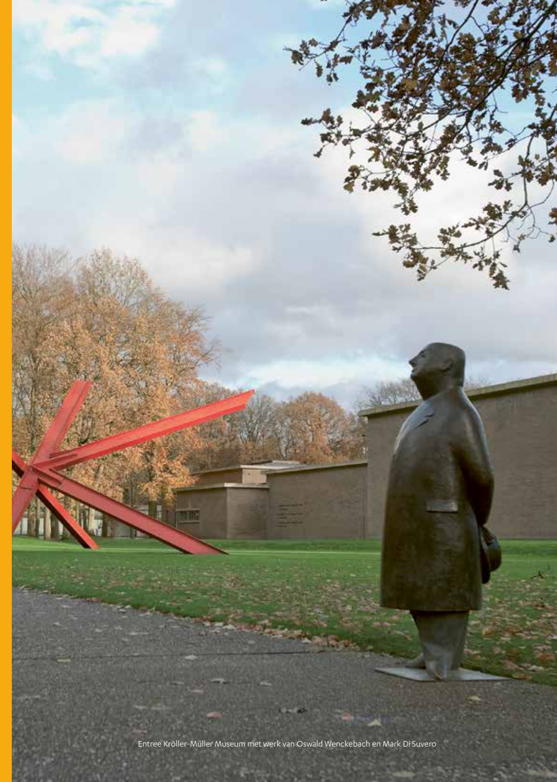
Entree Kröller-Müller Museum met werk van Oswald Wenckebach en Mark Di Suvero