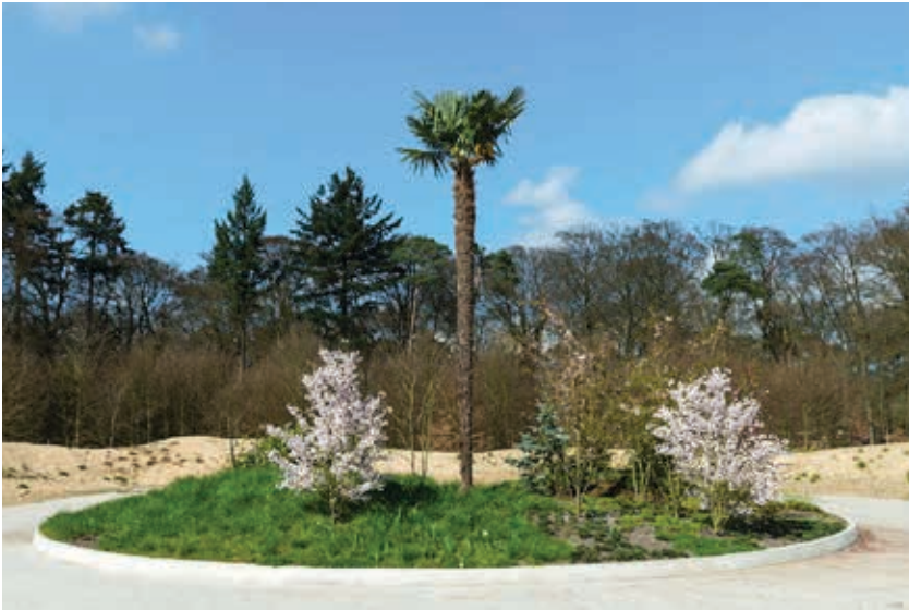
Pierre Huyghe, La Saison des Fêtes, 2010 (Ausführung 2016)

Das Museum wird von einem der größten Skulpturenparks Europas umgeben. In diesem Ausstellungsraum auf 25 Hektar im Freien findet die moderne Bildhauerkunst einen natürlichen Platz. Verteilt über den Garten sind über 160 Skulpturen prägender Künstler von Aristide Maillol bis Jean Dubuffet und von Marta Pan bis Pierre Huyghe aufgestellt. Die Umgebung lädt zum Genießen ein, und zwar von Kunst und Natur gleichermaßen. Sich einfach auf den Rasen legen, ein gemütliches Picknick mit Freunden und Familie oder ein Spaziergang durch den Park: Der Skulpturenpark bietet für jeden etwas.