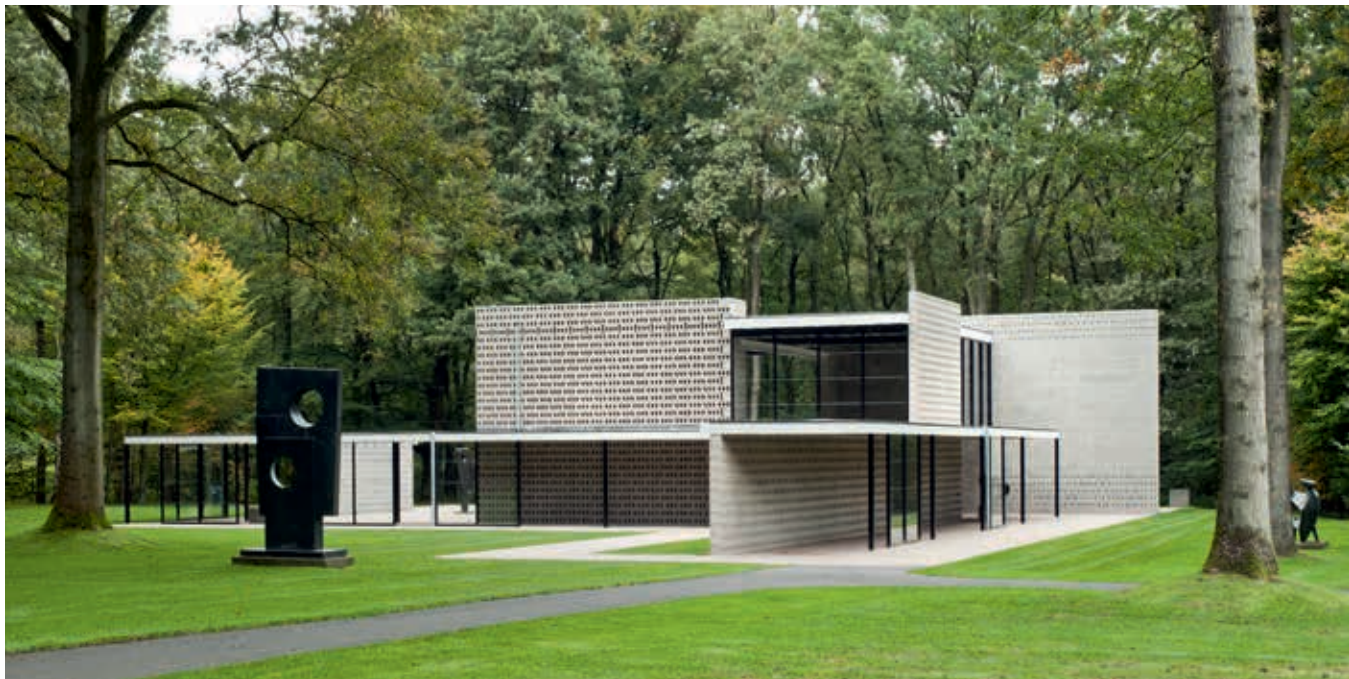
Rietveld-Pavillon mit Werken von Barbara Hepworth