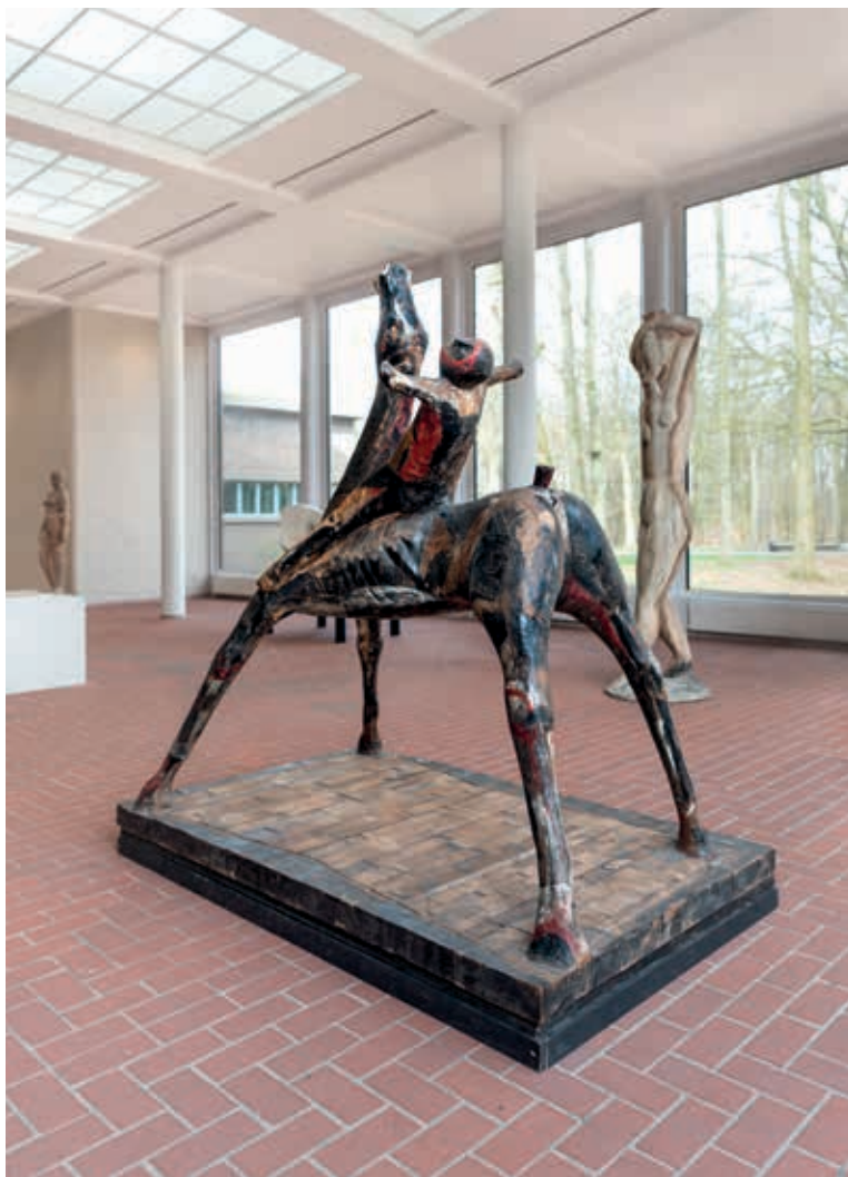
Skulpturensaal, im Vordergrund Pferd und Reiter, 1951-1955, von Marino Marini

Im Kröller-Müller Museum kommt alles Schöne zusammen. Die einzigartige Kombination von Kunst, Natur und Architektur ist der Garant für ein ganz besonderes Erlebnis. Ein Erlebnis, das alle Sinne anspricht. Das Museum ist sowohl für erfahrene Kunstliebhaber als auch für unbefangene „Newcomer“ ein Paradies. An keinem anderen Ort auf der Welt können Sie eine derartige Kombination von Kunst in Form einer atemberaubenden Kollektion und der einmaligen Lage inmitten der Natur erleben. Mit über 400.000 Besuchern pro Jahr gehört das Kröller-Müller Museum zu den am meisten besuchten Museen der Niederlande und ist auch beim internationalen Publikum äußerst beliebt. Ausgeliehene Meisterwerke erreichen weltweit ein Millionenpublikum.