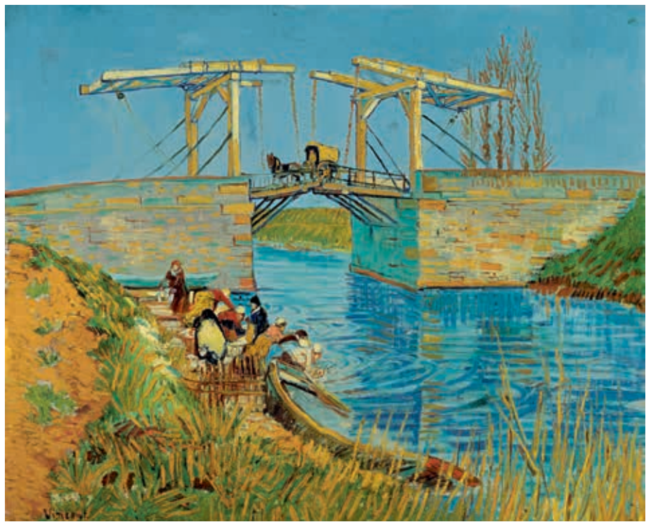
Vincent van Gogh, Brücke in Arles (Pont de Langlois), 1888