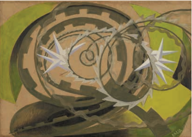
Giacomo Balla, Form und Lärm der Motorradfahrer, 1913

Das Kröller-Müller Museum ist das Lebenswerk von Helene Kröller-Müller. Zwischen 1907 und 1922 kaufte sie gemeinsam mit ihrem Mann Anton Kröller fast 11.500 Kunstwerke und schuf so eine der größten privaten Kunstsammlungen des zwanzigsten Jahrhunderts. Helene träumte von einem eigenen „Museumshaus“, einem Ort, an dem sie ihre Liebe für die moderne Kunst mit anderen teilen konnte. Mit der Eröffnung des Kröller-Müller Museums im Jahr 1938 wurde Helenes Traum Wirklichkeit. Ihre Nachfolger erweiterten das Museum mehrfach mit Neubauten und einen umfangreichen Skulpturenpark. Im Laufe der Jahre entwickelte die Sammlung sich zu einer der wichtigsten Kollektionen im Bereich der modernen Kunst.