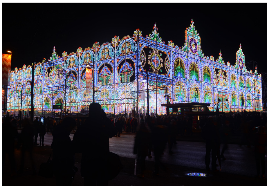
Beeld GLOW Festival Eindhoven in 2015

Voor alle (aanstormende) restauratoren, conservatoren, registrars, kunsthistorici, beheer- en behoudsmedewerkers, collectiebeheerders, onderzoekers en anderen die geïnteresseerd zijn in conservering, documentatie, installatie en presentatie van moderne en hedendaagse kunst.