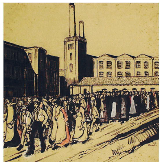
Bart van der Leck, 1876 - 1958 Uitgaan van de fabriek (studie) , 1908

Het is ondertussen 1917: een belangrijk jaar voor Bart van der Leck... en voor De Stijl! Van der Leck ontmoet Piet Mondriaan. De kunstenaars zijn onder de indruk van elkaars werk. Ze werken korte tijd samen.