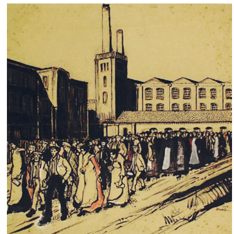
Bart van der Leck, 1876 - 1958 Uitgaan van de fabriek (studie) , 1908

Het is ondertussen 1917: een sleuteljaar voor Bart van der Leck.. en voor De Stijl! Van der Leck laat zijn contract met het echtpaar Kröller ontbinden en ontmoet Piet Mondriaan. De kunstenaars zijn onder de indruk van elkaars werk en werken korte tijd samen.