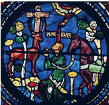
Chartres – het visioen van Eustachius