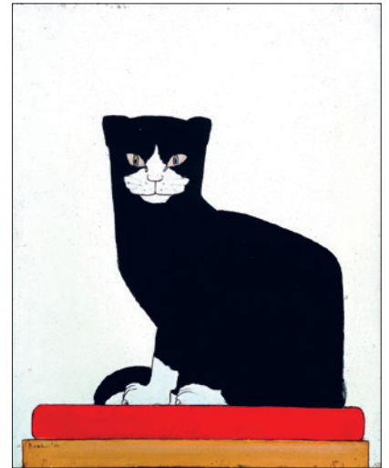
Bart van der Leck, 1876 - 1958 De kat , 1914

3 Is deze kat nog ‘echt’ of toch al ‘abstract’? Waar scoor je dit schilderij op onderstaande lijn?