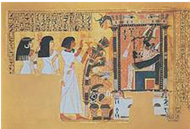
Louvre – Begrafenis uit het 'Boek van de doden' (1400 voor Christus).