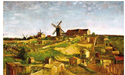
Vincent van Gogh, 1853 - 1890 La butte Montmartre, april - mei 1886

Bekijk het zelfportret dat Van Gogh in Parijs maakte (of kies één van deze landschappen: Moulin de la Galette of La butte Montmartre )