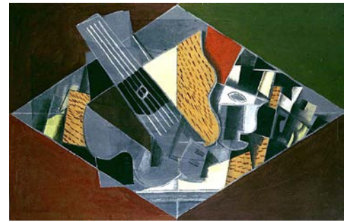
Georges Braque, 1882 - 1963 Gitaar en glas, 1917

In 1911 ‘ontdekt’ Mondriaan in Parijs het kubisme. De nieuwe werkwijze van o.a. Picasso en Braque maakt veel indruk. Vooral de manier waarop ze de werkelijkheid steeds verder abstraheren, maar ook het uitgangspunt dat de compositie van het schilderij belangrijker is dan de kleur.