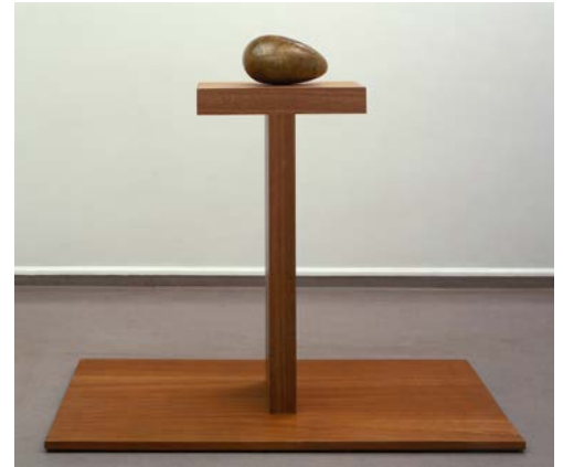
Stanley Brouwn, 1935 Sokkel voor 'Le Commencement du monde' van Constantin Brancusi, 1995

Constantin Brancusi bedacht ook hoe je zijn kunstwerken kon presenteren. Bij dit werk bedacht hij dat je het eigenlijk op schoot moest nemen, op een kussentje. Vanwege de veiligheid ligt het werk toch in een vitrine. Kunstenaar Stanley Brouwn maakte speciaal voor het kunstwerk een speciale sokkel, gebaseerd op een zelfbedacht meetsysteem.