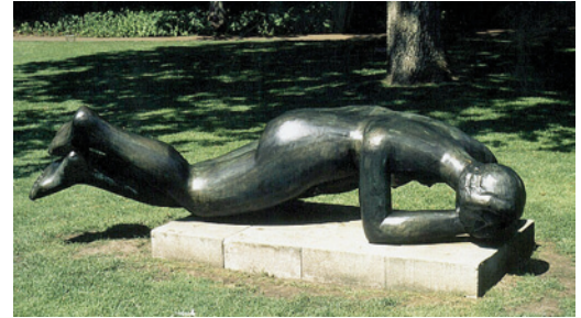
Constant Permeke, 1886 - 1952 Niobe , 1951