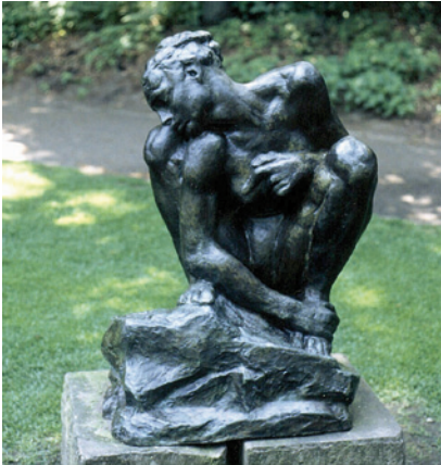
Auguste Rodin, 1840 - 1917 Hurkende vrouw , 1882

Hieronder zie je drie kunstwerken, de eerste is het oudst, de laatste het jongst.