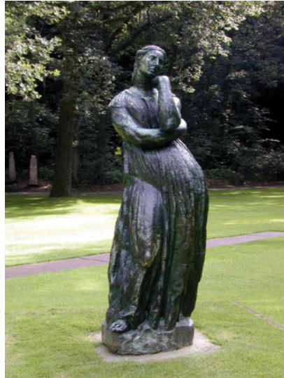
Émile-Antoine Bourdelle, 1861 - 1929 La grande Pénélope , 1912